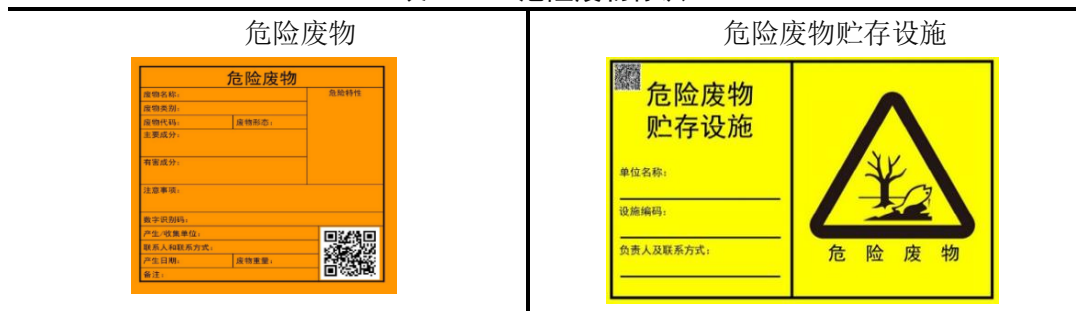
表 27 危险废物标识

项目总投资为 1300 万元，其中环保投资 65.5 万元，占总投资的 5.04%，详见表 28。