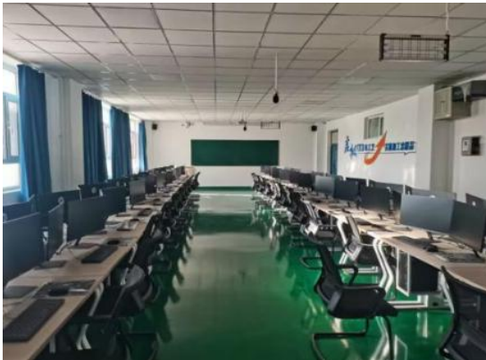
图 25 数字化实训室场景图

机电工程学院针对机械制造及自动化、电气自动化技术、机电一体化技术等专业课程需求，解决原有计算机绘图实训室设备老旧、性能不足问题，新建实训基地配备 51 台二维设计终端、51 台三维设计终端，配套 51 套 CAD 及三维设计软件，并新增 6 台 3D 打印机、2 台立式加工中心、测绘量具及教学设备。基地建成后，将有效支撑数字化设计、逆向工程等实践教学，培养高素质技术技能人才；服务技能大赛培训，提升师生实战能力，助力“双师型”师资队伍建设；深化校企合作，承接横向课题，服务企业技术需求；推动“岗课赛”融通落地，紧跟行业新技术、新工艺发展，全面提升人才培养质量与社会服务能力。