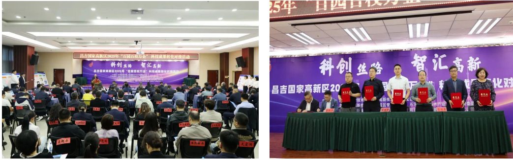
图42 昌吉国家高新区2025年“百园百校 图43企业与高校签订合作协议 万企”科技成果转化对接活动现场

探索行业产教融合共同体建设。 围绕自治州产业发展，坚持服务学生全面发展和经济社会高质量发展，坚持以教促产、以产助教，加快形成产教良性互动、校企优势互补的产教深度融合发展格局，支持院校联合行业企业成立产教融合共同体。目前昌吉州已打造行业产教融合共同体8个，其中新疆农业职业技术学院牵头成立全国智慧灌溉、全国智慧农业、全国现代马产业、全国现代种业、全国智能农机装备、新疆特色果蔬、新疆现代畜牧等7个行业产教融合共同体；昌吉职业技术学院牵头成立新疆康养行业产教融合共同体，着力培养高素质复合型技术人才。