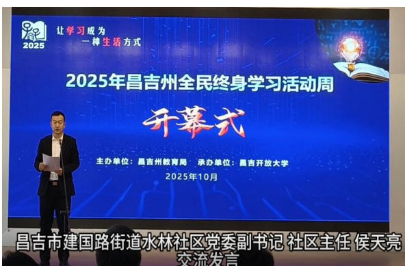
图29昌吉州全民学习活动周开幕式活动现场

策法规宣传5000余人次，提高国家和区、州政府相关政策普及率；开展了国家通用语言培训近万人次，着力提高少数民族学生的汉语水平，同时加强传承中华优秀传统文化的阅读活动，以文化润疆铸牢中华民族共同体意识。昌吉市开展了书香进校园、纪念一二九等丰富多彩的活动。昌吉州行知学校充分利用校园广播、国旗下的讲话、主题班会、电子横幅等多种形式向1353名学生广泛宣传终身学习理念，辐射上千个家庭，助力终身学习理念深入人心。昌吉州实验小学开展了包括全民健康知识，“书香浸润心灵，悦读启悟人生”教师读书分享交流会等活动，教职工全员参与。开展了国家通用语言培训近万人次，着力提高少数民族学生的汉语水平，同时加强传承中华优秀传统文化的阅读活动，以文化润疆铸牢中华民族共同体意识。昌吉市开展了书香进校园等丰富多彩的活动。掀起了全民学习终身学习的热潮。