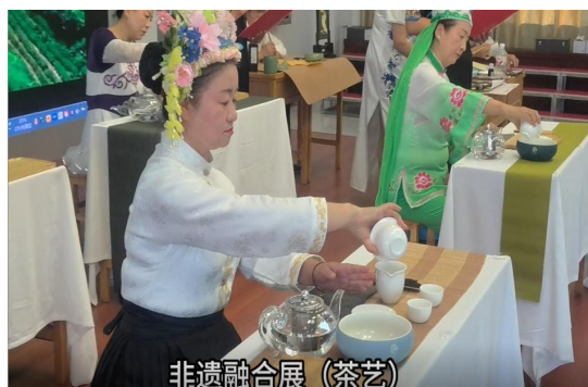
图32 老年教育茶艺展示