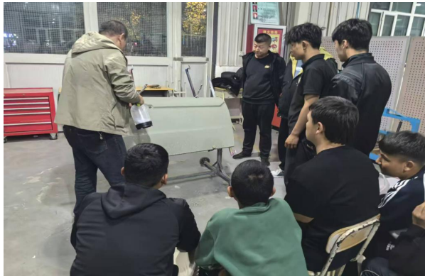
图41 学生在汽修厂实地学习