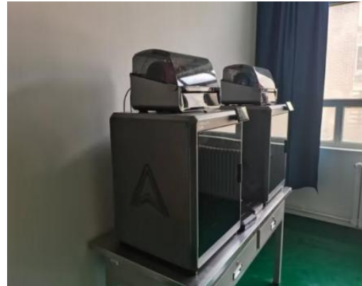
图 26 数字化设备