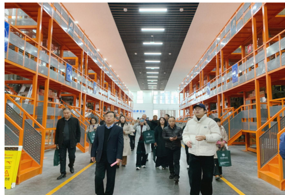
图 49 参观职业学校实训中心