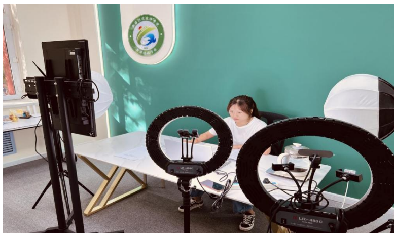
图 18 数字媒体专业学生在实训基地练就技能