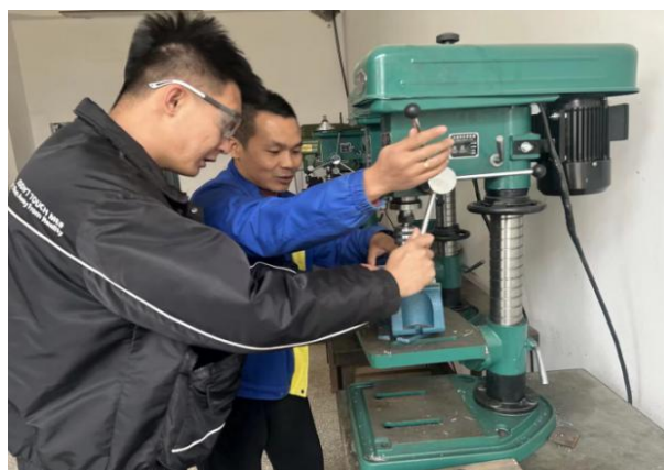
图 28 青年教师一对一帮带

以教师教学能力比赛为抓手，促进教师教学能力提升，教学理念和教学模式创新，各职业院校申报 2025 年自治区教学成果奖 11 项，获奖 9 项，其中昌吉职业技术学院《“五池融合双轮驱动、五化一体四维对接”高职院校协同育人模式创新与实践》获自治区特等奖，1 等奖 1 个，二等奖 7 个。组织职业院校参加 2025 年教师教育教学能力大赛，遴选出中职 13 组项目参赛，获奖 12 个，遴选高职 7 组项目参赛，获奖 3 项。