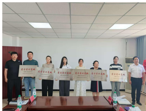
图45为企业颁发实习实训基地牌匾