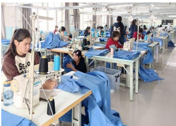
图39学生与企业交流实践教学事宜