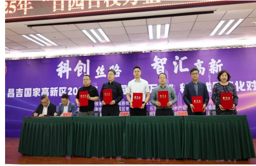
图42 昌吉国家高新区2025年“百园百校 图43企业与高校签订合作协议 万企”科技成果转化对接活动现场

探索行业产教融合共同体建设。 围绕自治州产业发展，坚持服务学生全面发展和经济社会高质量发展，坚持以教促产、以产助教，加快形成产教良性互动、校企优势互补的产教深度融合发展格局，支持院校联合行业企业成立产教融合共同体。目前昌吉州已打造行业产教融合共同体8个，其中新疆农业职业技术学院牵头成立全国智慧灌溉、全国智慧农业、全国现代马产业、全国现代种业、全国智能农机装备、新疆特色果蔬、新疆现代畜牧等7个行业产教融合共同体；昌吉职业技术学院牵头成立新疆康养行业产教融合共同体，着力培养高素质复合型技术人才。