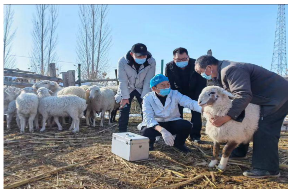
图 34 畜禽专业师生开展牛羊疾病防治