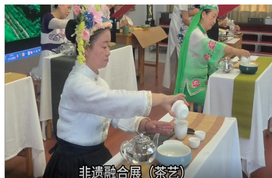
图32 老年教育茶艺展示