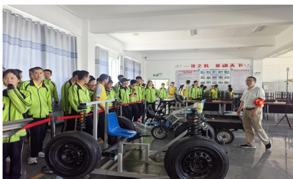
图 16 中学生到汽修实训室体验

2025 年职业教育活动周期间，呼图壁中等职业学校高度重视、全方位统筹职业教育和普通教育的融通工作，精心策划并邀请全县中学生分批走进学校，通过沉浸式体验深入感受各特色专业的教学成果与实践氛围。累计接待来自全县多所中小学校的 286 名学生，有效激发广大学生的劳动意识、动手能力与职业兴趣，成功构建起一个认知职业教育、贴近职业现场的新窗口。中考前，学校招生就业办牵头组织专业教师队伍赴县中学开展招生宣传与政策解读工作，系统阐释国家职业教育政策导向下中职院校构建的多元化升学通道，结合学生个体发展需求科学规划升学路径，详细解读各专业设置与个人发展规划的匹配度，切实助力学生职业生涯科学规划。