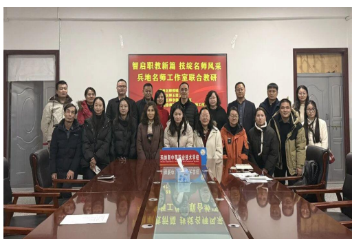
图50师生赴兵团参加实践教学活

达100余人次，力争使双方学校教育理念有所更新，办学行为进一步规范，规章制度进一步健全，队伍建设上有新突破，教育教学质量上有新提高。3所中职学校与兵团高职学校合作开展“3+2”、“2+3”中高职贯通培养，涉及专业有机电技术应用、幼儿保育、工业机器人技术应用、数字媒体技术、旅游管理、中西面点、烹饪等7个专业，本年度联合招生400余人。