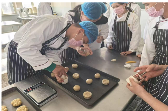
图 35 师生做月饼 图 36 中秋节主题班会

师生在了解中秋文化、感受团圆氛围的过程中，深化对国家、民族的归属感，厚植家国情怀，责任感进一步增强。活动以中秋佳节为载体，将中华优秀传统文化融入主题班会、黑板报创作、美食制作等环节，让学生切实体会传统文化魅力，文化认同与传承意识显著提升。活动将文化传承与中职技能实践结合，融入专业特色，既发挥了中职学校技能培养优势，又让学生在实践中传承文化，契合中职教育定位。