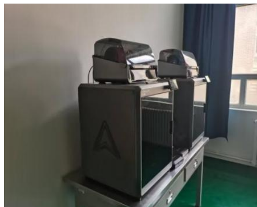
图 26 数字化设备