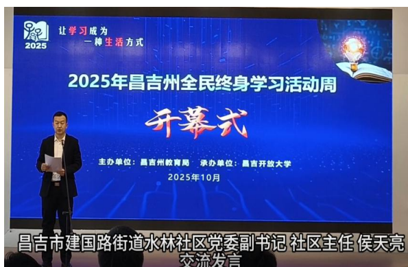
图29昌吉州全民学习活动周开幕式活动现场

策法规宣传5000余人次，提高国家和区、州政府相关政策普及率；开展了国家通用语言培训近万人次，着力提高少数民族学生的汉语水平，同时加强传承中华优秀传统文化的阅读活动，以文化润疆筑牢中华民族共同体意识。昌吉市开展了书香进校园、纪念一二九等丰富多彩的活动。昌吉州行知学校充分利用校园广播、国旗下的讲话、主题班会、电子横幅等多种形式向1353名学生广泛宣传终身学习理念，辐射上千个家庭，助力终身学习理念深入人心。昌吉州实验小学开展了包括全民健康知识，“书香浸润心灵，悦读启悟人生”教师读书分享交流会等活动，教职工全员参与。开展了国家通用语言培训近万人次，着力提高少数民族学生的汉语水平，同时加强传承中华优秀传统文化的阅读活动，以文化润疆筑牢中华民族共同体意识。昌吉市开展了书香进校园等丰富多彩的活动。掀起了全民学习终身学习的热潮。