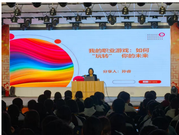
图 12 创新创业培训

新精神、强化创业意识，积极组织学生参加“互联网+”创新创业大赛，帮助学校中职生树立创业意识，完善创业知识结构，掌握创业技能，以创业促就业，提升就业创业能力。