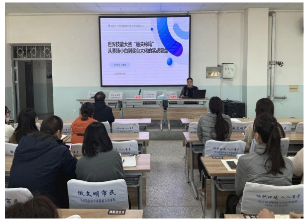
图 24 校际联合开展教研活动