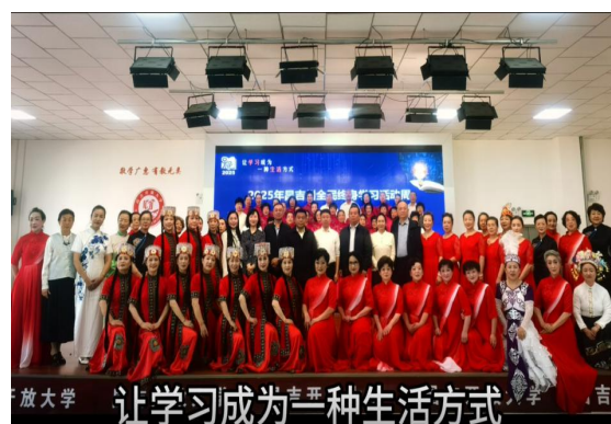
图30 全民终身学习活动周开幕式合影