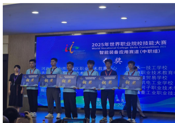
图 15 吉木萨尔中职学校“智能制造设备技术应用”赛项荣获铜奖