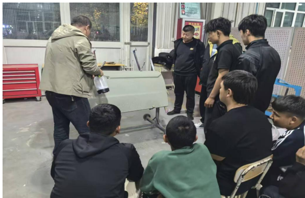
图41 学生在汽修厂实地学习