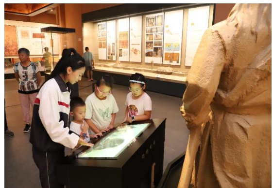
图 19 “丝路北庭思政工作室”揭牌 图 20 学生志愿者向游客解说