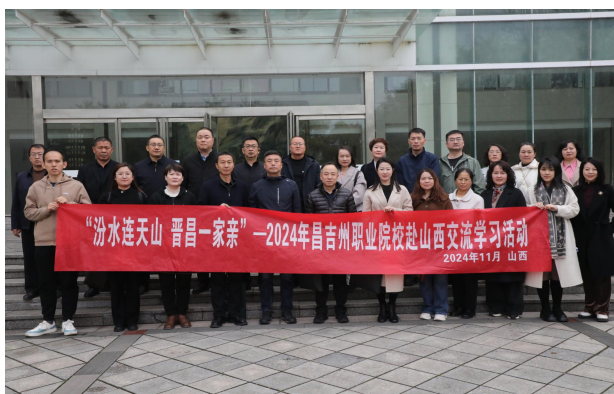
图 48 职业院校赴山西交流学习活动

办、山西开放大学承办，旨在通过教育交流，增进两地职业院校之间的交流与合作，共同推动职业教育事业的发展。昌吉州各县市教育局主要领导、职业院校班子成员、中层领导及一线教师一行21人参加此次交流学习活动。此次活动内容丰富、形式多样，通过座谈交流、实地观摩、听取介绍等形式，深入了解山西省职业教育整体规划、发展布局及部分优质职业院校（晋中职业技术学校、平遥现代工程技术学校等）在办学理念、智慧校园建设、教学管理、教师培养、技能竞赛等方面的典型经验和成功实践，为昌吉州推动职业教育发展提供思路和可借鉴经验。