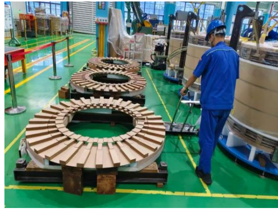
图 11 刘力玮在企业实践