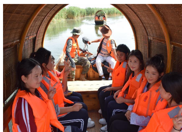
图 4: 湿地公园游船