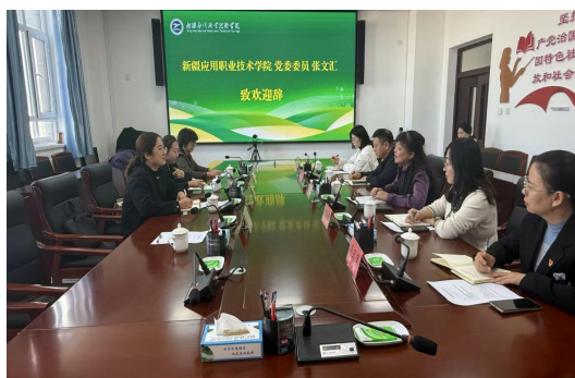
图51师生参观屯垦文化展览馆