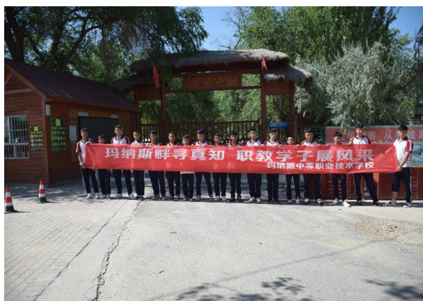
图 3: 古尔邦节研学平原林场

玛纳斯中等职业技术学校开展“双节同庆赏家乡美景 携手同行育团结之花”研学活动。端午节、古尔邦节放假期间，教官带领 500 余名留校学生外出研学，通过实地探访家乡的产业（酒庄）、历史（军垦）、生态（湿地），激发“知家乡、爱家乡、建家乡”的责任感，树立“我的家乡我守护”的环保与发展意识。古尔邦节研学，以“文化浸润+实践赋能”为核心，让职教学生在行走中求知、在体验中成长。玛纳斯中职校将持续总结经验，优化研学设计，让此类活动成为培育“知行合一、德技并修”人才的重要引擎，助力职业教育高质量发展。