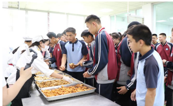
图 17 中学生到烹饪实训室体验