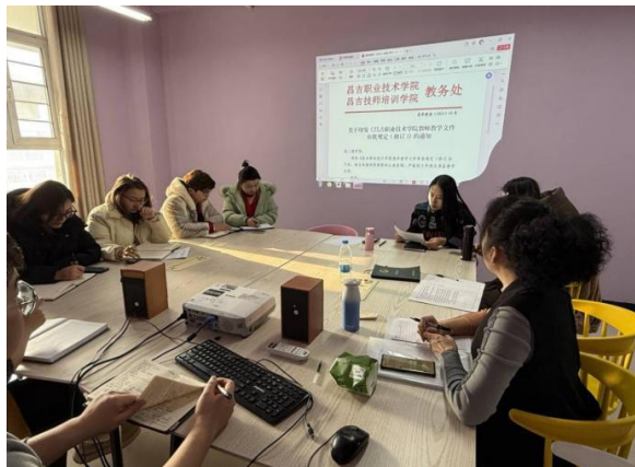
图 27 教师集体备课现场