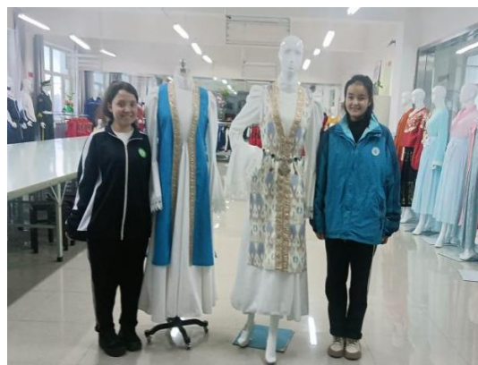
图40服装制作与生产管理专业 学生作品