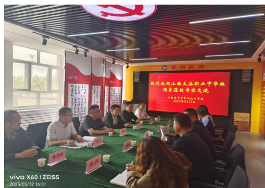
图46湄洲湾职业技术学校送教入疆 图47木垒中职与太谷职业中学座谈