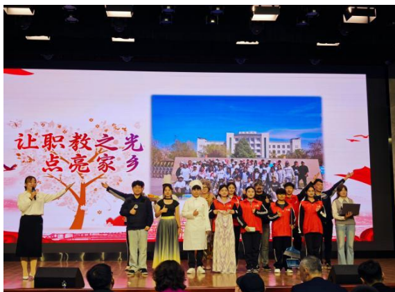
图 8 新时代文明实践交流展示

(微党课、微讲堂、微阅读、微志愿、微培训)，联动开展党建文化活动，组织动员社区学生党员入党积极分子、团员开展常态化社会实践，深入群众中开展志愿服务和思想宣传活动，形成党员、团员与社区协同联动的良好机制。鼓励学生社区党团小组开展“结对共建”计划，以先进促后进，以典型带全体，构建起优势互补、资源共享、协同发展的社区党建新格局。