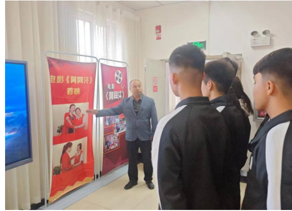
图 5 参观红色教育基地—阿同汗社区 图 6: 由法治副校长校长实地讲解思政课