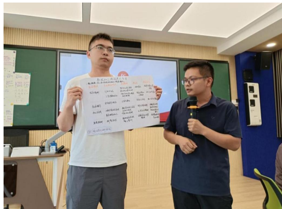
图 22 教学方法提升培训成果展示