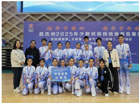
图 9 代表参加昌吉州体育竞赛志愿服务