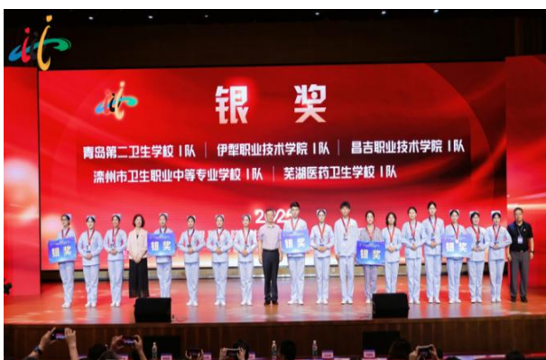
图 14 昌吉职业技术学院“康复治疗技术”赛项荣获银奖