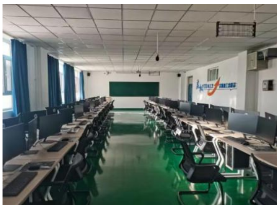
图 25 数字化实训室场景图

机电工程学院针对机械制造及自动化、电气自动化技术、机电一体化技术等专业课程需求，解决原有计算机绘图实训室设备老旧、性能不足问题，新建实训基地配备 51 台二维设计终端、51 台三维设计终端，配套 51 套 CAD 及三维设计软件，并新增 6 台 3D 打印机、2 台立式加工中心、测绘量具及教学设备。基地建成后，将有效支撑数字化设计、逆向工程等实践教学，培养高素质技术技能人才；服务技能大赛培训，提升师生实战能力，助力“双师型”师资队伍建设和；深化校企合作，承接横向课题，服务企业技术需求；推动“岗课赛”融通落地，紧跟行业新技术、新工艺发展，全面提升人才培养质量与社会服务能力。