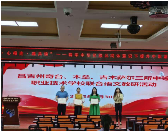
图 23 校际联合开展教研活动