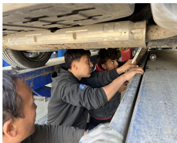
图 13 学生在汽修厂工作现场