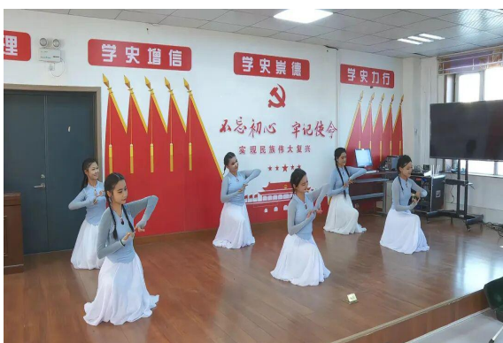
图 33 中职学生参加乡村文化活动

谊活动，通过舞蹈《谁家大美人》《铃铛少女》等精彩节目，为当地群众带来了一场视听盛宴，丰富了村民特别是老年人的精神文化生活，获得群众热烈反响。活动以文艺展演与技能交流相结合的方式，不仅展现了职校风采，也使师生深入乡村，切身感受乡土文化，增强了服务基层的社会责任感。此次活动成功搭建起城乡文化交流的桥梁，推动了职业教育资源下沉，探索出以文化为纽带、促进校村联动、服务乡村振兴的有效路径。将教育发展融入乡村发展，通过“情感连接+资源对接”实现精准服务，从而在丰富基层文化供给、凝聚城乡发展合力、助推县域高质量发展方面发挥可持续的积极作用。