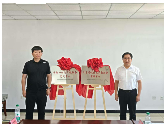
图44为产教融合实践中心揭牌

任公司、新疆金科元健康科技有限公司6家产教联合体理事会成员单位颁发实习实训基地牌匾，并为千亩有机蔬菜产教融合实践中心、水肥一体化产教融合实践中心揭牌。新疆农业职业技术大学生物科技学院、粮油食品与物资储备学院、农业工程学院、动物科技学院、生态园林工程学院、科学技术处与产教联合体理事单位代表围绕技术共研、人才共育、平台共享等方面进行交流，在畜牧领域高层次人才引育、农业节水装备联合攻关等方面达成合作共识。昌吉国家农高区现代农业产教联合体是2024年获批的新疆首个国家级市域产教联合体，现有理事会成员单位75家，实习实训基地及产教融合中心的建立，即是深入贯彻落实国家关于深化产教融合、科教融汇决策部署的具体实践，又是昌吉国家农高区现代农业产教联合体的重点任务，更是推动教育与产业深度融合、破解人才供需矛盾、促进经济社会高质量发展的重要举措。