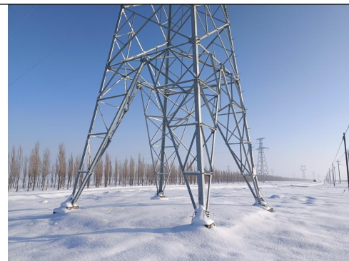
建成猛狮光电 50MW 光伏 110kV 升压站~吉木萨尔(潘家台)220kV 光伏升压汇集站 110kV 送出线路 1 号杆塔(未挂牌)