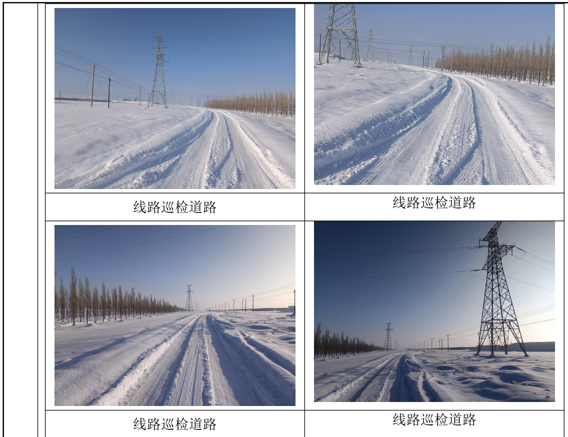
图 3-1 猛狮光电 50MW 光伏 110kV 升压站~吉木萨尔（潘家台）220kV 光伏升压汇集站 110kV 送出线路周边环境现状