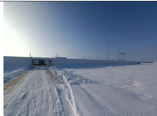
猛狮吉木萨尔光伏电场 110kV 升压站