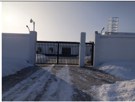
猛狮吉木萨尔光伏电场 110kV 升压站

工程区域保护对象主要是野马、野驴、盘羊、野山羊等有蹄类野生动物，以及野生动物赖以生存的自然环境和水资源。场址周围未发现受保护的国家一、二级野生动物。工程区域自然环境概况见图 3-1。