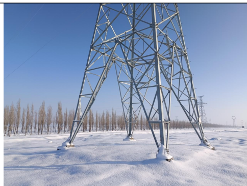
建成猛狮光电 50MW 光伏 110kV 升压站~吉木萨尔(潘家台)220kV 光伏升压汇集站 110kV 送出线路 1 号杆塔(未挂牌)