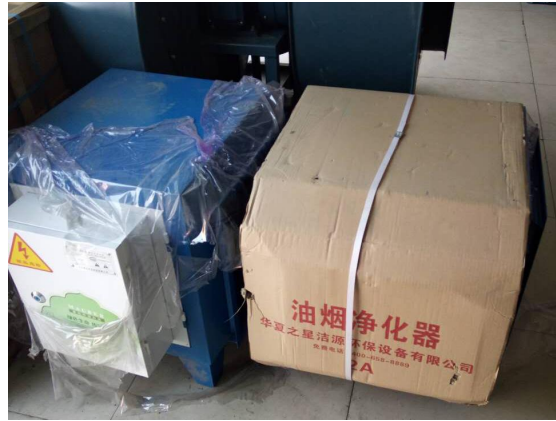
油烟净化器（拟安装）