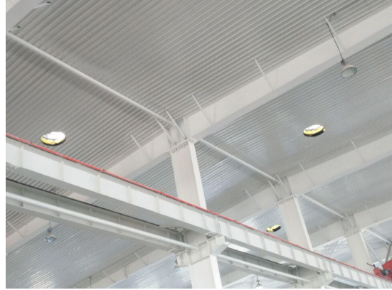
车间顶部通风换气扇