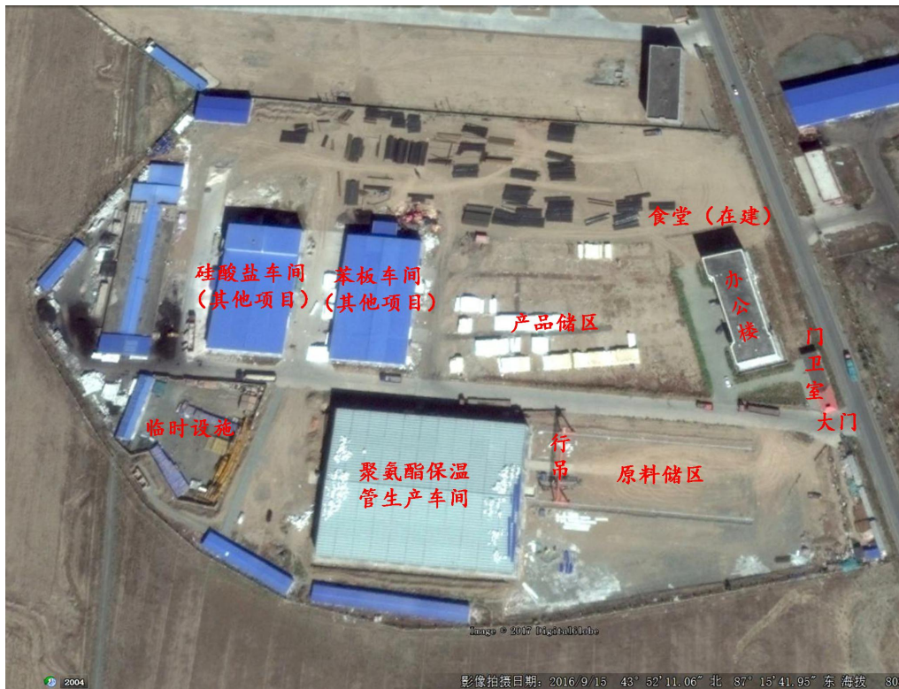
表 3.3-1 项目总体平面布置图

项目区平面布置见图 3.3-1，部分构筑物现场照片见图 3.3-2。。项目建设位置与环评阶段保持一致。