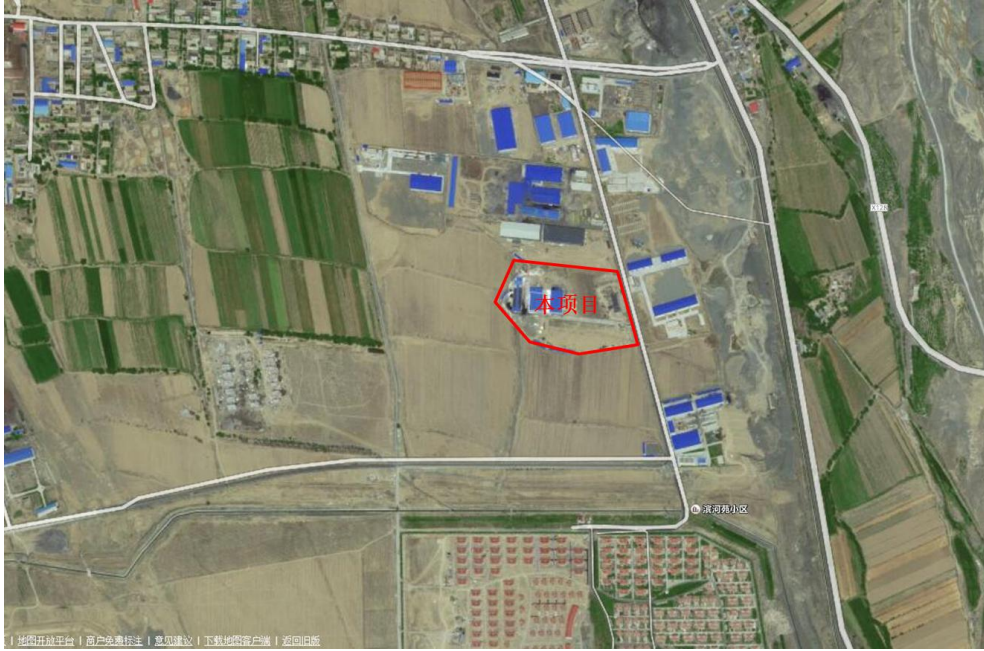
图 3.1-2 项目周边环境示意图